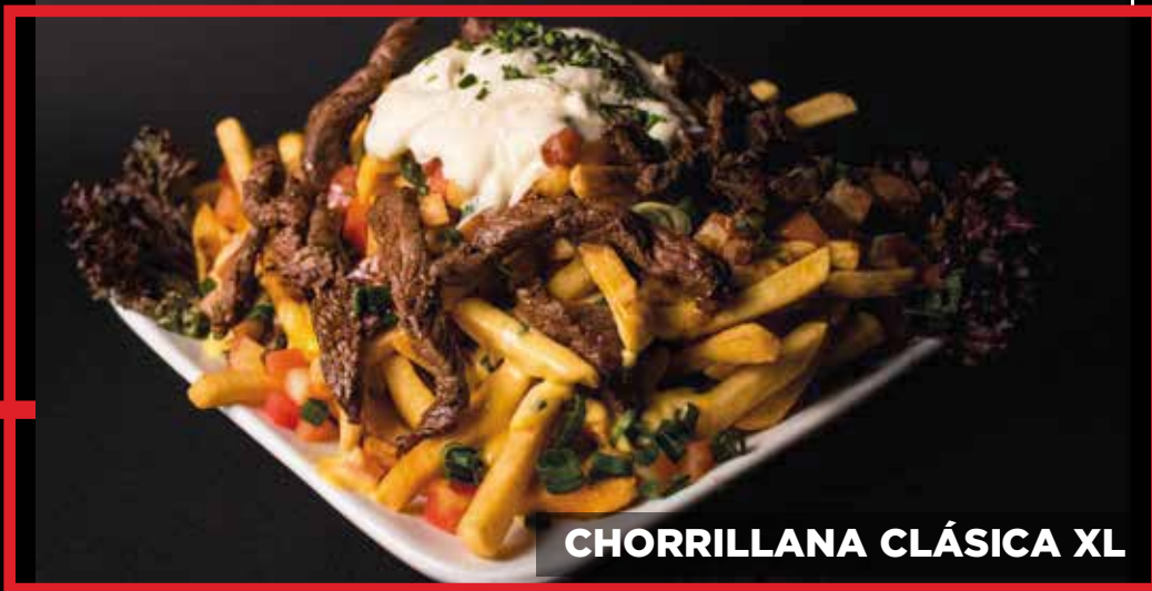
CHORRILLANA CLÁSICA XL